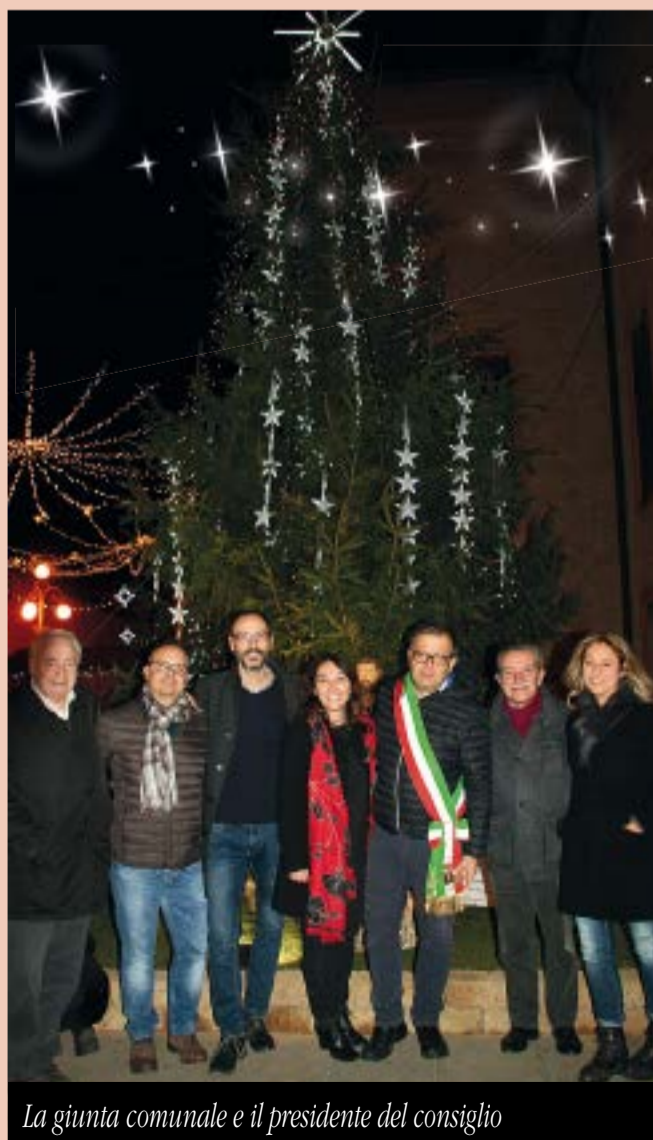
La giunta comunale e il presidente del consiglio

Ah! Quasi mi dimenticavo! Auguri anche di Buon 2018 ...Donna! ...ovviamente!