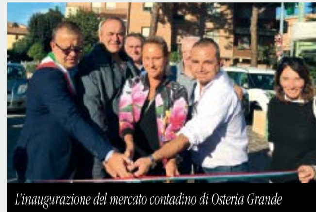
L'inaugurazione del mercato contadino di Osteria Grande

Bancarelle aperte il mercoledì dalle ore 15 alle ore 19