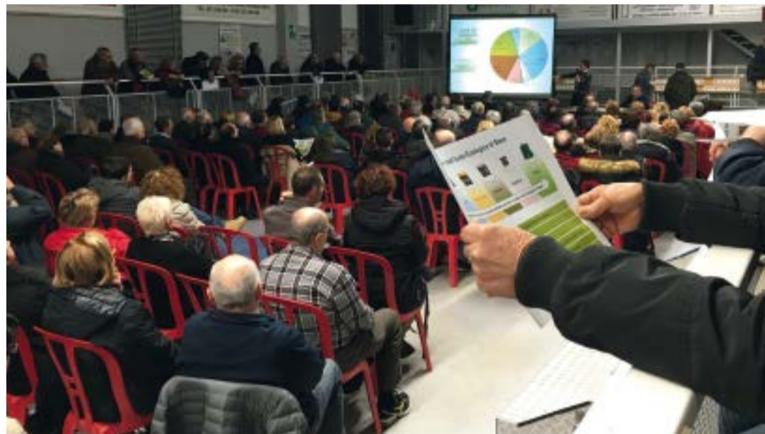
Grande partecipazione agli incontri informativi sulla nuova raccolta rifiuti organizzati da Comune e Hera nella prima metà di dicembre alle Bocciofile di Castel San Pietro Terme e di Osteria Grande.

A partire da fine febbraio 2018 i cittadini e le attività dell'intera città inizieranno a utilizzare il nuovo sistema, che prevede l'organizzazione dei contenitori in Isole Ecologiche di Base