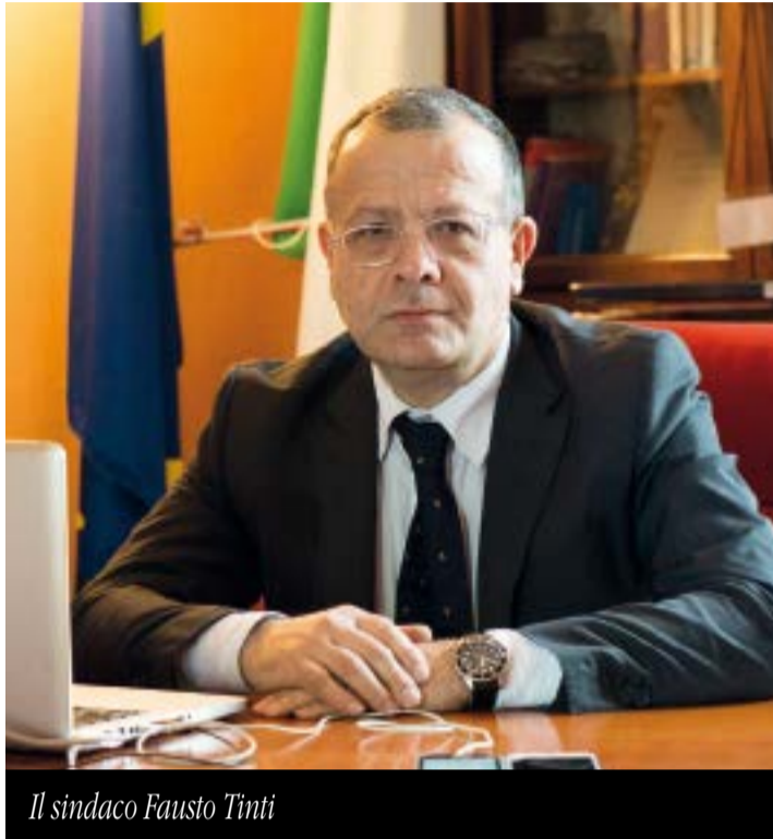
Il sindaco Fausto Tinti

Ottime notizie per le casse comunali di Castel San Pietro Terme che nel 2017 riceveranno dal Ministero delle Finanze, tramite il Ministero dell'Interno, la somma di 496.469 euro, quale contributo alla lotta all'evasione fiscale statale riferita all'anno 2016. Un risultato importante ottenuto grazie all'impegno dell'Ufficio tributi comunale che ha attiva-