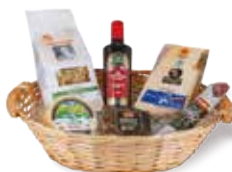
BUCANEVE € 57,00