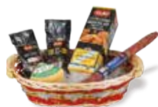
CALENDULA € 34,00