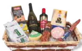
PUNGITOPPO € 75,00